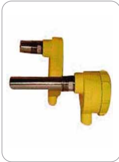
Fluido / SW

Indicación proporcional del volumen o de la altura del nivel en forma visual y digital.