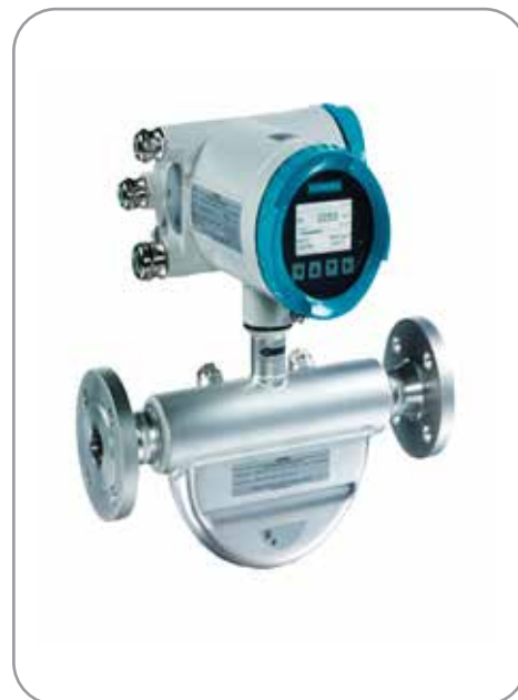
Caudal HC (oil)

Medición de Agua con caudalímetros electromagnéticos.